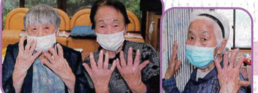
毎月初めはメイクアップデー