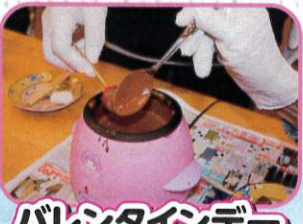
バレンタインデー