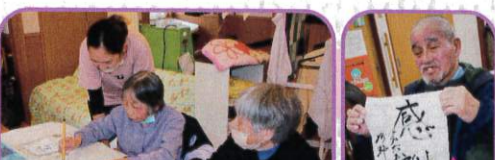
習字の日 (毎週木曜日)