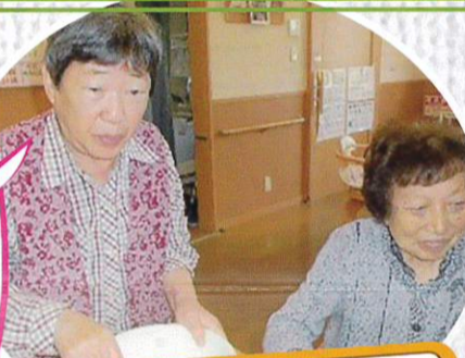
9/20 梨の花 おやつ作り