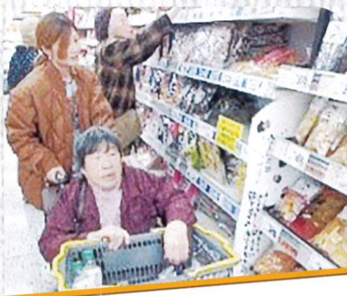
11/21 アピタ ショッピングセンター