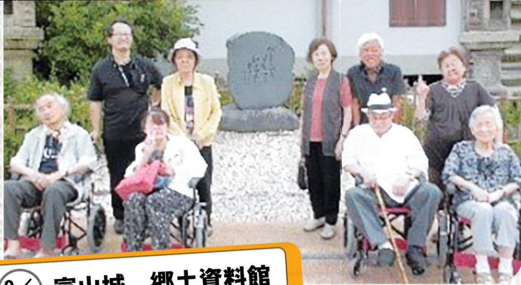
9/18 富山城 郷土資料館