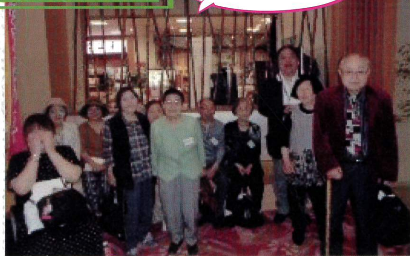
「天晴温泉磯はなび」へ日帰り旅行しました。総勢50名で温泉と海の幸を堪能しました。